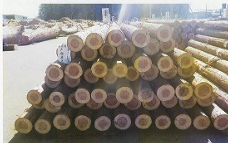
栃木県知事賞 (スギ小丸太) 戸村 貞夫 様